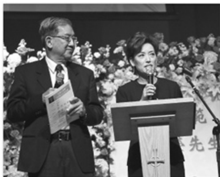
美國國會眾議員羅斯·愛德華代表：金楊女士