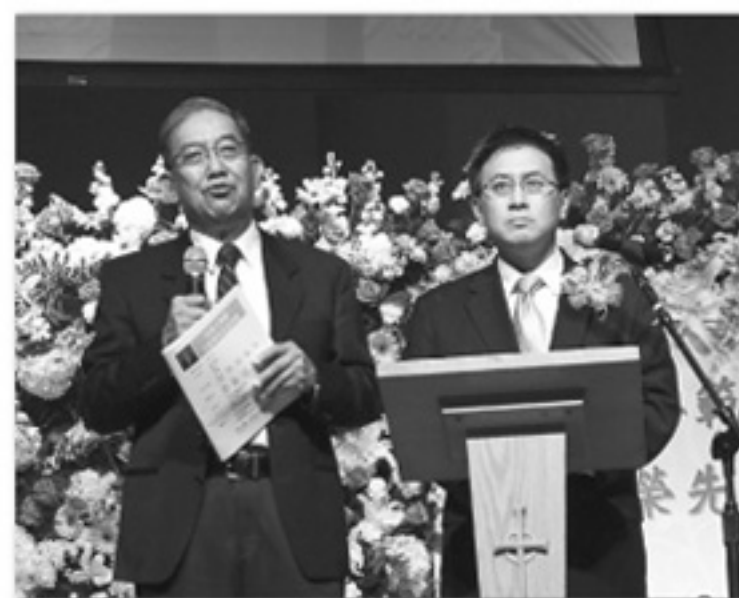
加州州政府審計長江俊輝先生